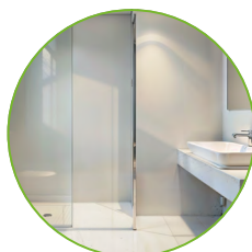
Áreas frias no sistema convencional e no sistema drywall