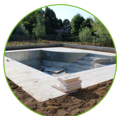
Piscinas de concreto