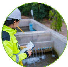
Reservatórios de água potável